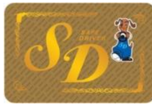
⑤スーパーゴールドカード(20年以上)