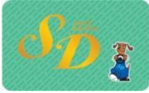
①グリーンカード(1年以上)