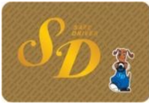
④ゴールドカード(10年以上)