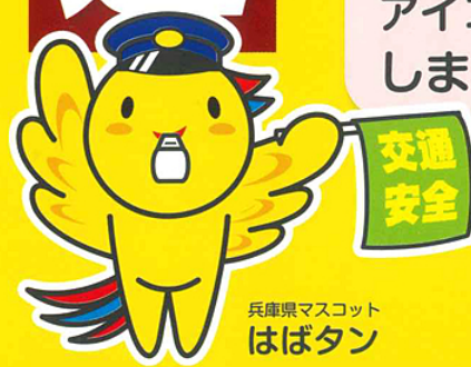
兵庫県マスコット はばタン