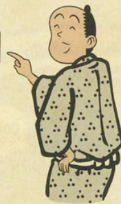
盗難防止ネジ 付けたんだろ